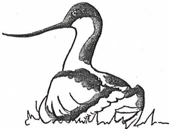
(Kluut. Recurvirostra avosetta )

Een waarneming van een mannetje op de wei. het viel niet vast te stellen of dit een ontsnapt exemplaar was . opgemerkt dient te worden dat het verenkleed in uitmuntende staat verkeerde.